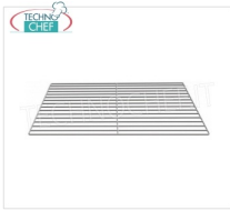
TECHNOCHEF - Griglia plastificata GN 1/1, Mod.GRPLTGN