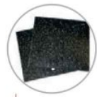
Set tavole di riempimento in polietilene Polyethylene filling squares set