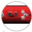
Pannello digitale Digital panel

STANDARD FUNCTION ONLY FOR CHAMBER MACHINES