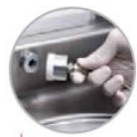
Connessione per attacco gastrovac Connection for the gastrovac system