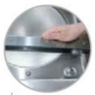
Barre saldanti estraibili Removable sealing bars