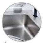
Vasca inox con angoli stondati senza saldature Entirely printed stainless steel vacuum chamber, with internal round corners