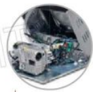
Carter apribile a 90° 90° openable carter