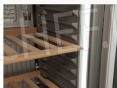
Ripiani regolabili in legno