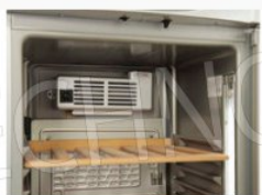
Ventilatore interno di assistenza