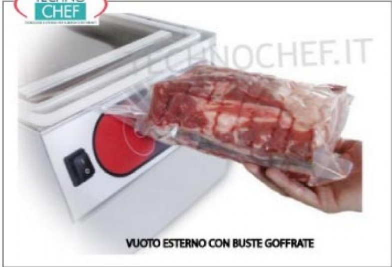
VUOTO ESTERNO CON BUSTE GOFFRATE