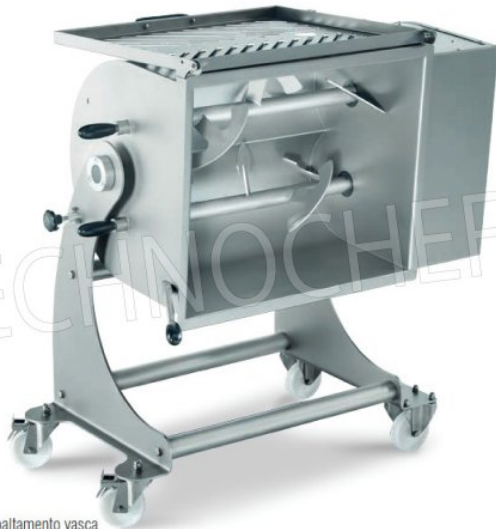
Ribaltamento vasca Tank overturn