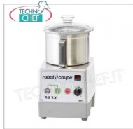
Table CUTTER R5 VV, capacité du réservoir lt.5,9, marque ROBOT COUPE, professionnel

Table CUTTER R5 VV, marque ROBOT COUPE, avec BOL EN ACIER INOXYDABLE amovible de 5,9 litres, Vitesse variable 300 / 3 500 tr/min, V. 230/1, Kw 1,50, Poids 22 Kg, dimensions 280x350x490h mm