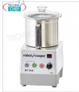
Table CUTTER R7 VV, capacité du réservoir lt.7.5, marque ROBOT COUPE, professionnel

Table CUTTER R7 VV, marque ROBOT COUPE, avec BOL EN ACIER INOXYDABLE amovible de 7,5 litres, Vitesse variable de 300 à 3500 tr/min, V. 230/1, Kw 1,5, Poids 23 Kg, dimensions 280x350x520h mm