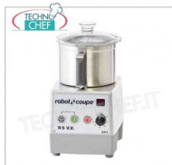
Table CUTTER R5 VV, capacité du réservoir lt.5,9, marque ROBOT COUPE, professionnel

Table CUTTER R5 VV, marque ROBOT COUPE, avec BOL EN ACIER INOXYDABLE amovible de 5,9 litres, Vitesse variable 300 / 3 500 tr/min, V. 230/1, Kw 1,50, Poids 22 Kg, dimensions 280x350x490h mm