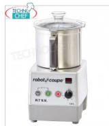
Table CUTTER R7 VV, capacité du réservoir lt.7.5, marque ROBOT COUPE, professionnel

Table CUTTER R7 VV, marque ROBOT COUPE, avec BOL EN ACIER INOXYDABLE amovible de 7,5 litres, Vitesse variable de 300 à 3500 tr/min, V. 230/1, Kw 1,5, Poids 23 Kg, dimensions 280x350x520h mm