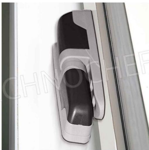
CERNIERE FACILMENTE REGOLABILI IN UTENZA IN 3 DIREZIONI