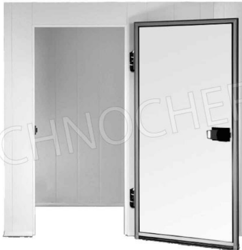
SU RICHIESTA: CELLA SENZA PAVIMENTO