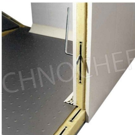
PAVIMENTO + PANNELLO: MONTAGGIO SEMPLICE E VELOCE TRAMITE FISSAGGIO CON AGGANCIAMENTO ECCENTRICO.