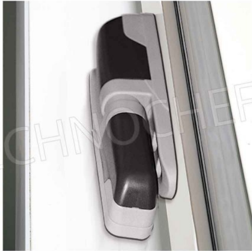
CERNIERE FACILMENTE REGOLABILI IN UTENZA IN 3 DIREZIONI