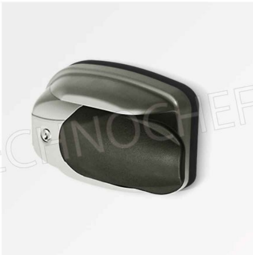
MANIGLIA STANDARD CON SERRATURA, CHIAVE A SBLOCCO INTERNO DI SICUREZZA