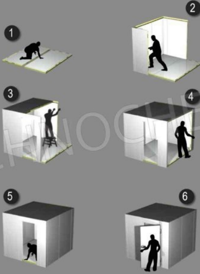
SEQUENZA DI MONTAGGIO PANNELLI