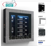
TABLEAU VIN RÉFRIGÉRÉ, 5 BOUTEILLES et 2 VERRES, Temp.+12°/+18°

Panneau à vin RÉFRIGÉRÉ, 5 Bouteilles et 2 Verres, version avec: Structure NOIRE, Panneau EN ECO-CUIR NOIR, Cadre STRATIFIÉ COULEUR MÊLÈZE CENDRÉ, Lumière LED Bleue, Temp.+12°/+18°, V.230/1, Kw. 0,06, Poids 30 Kg, dim.mm.780x780x155h