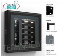
TABLEAU VIN RÉFRIGÉRÉ, 5 BOUTEILLES et 2 VERRES, Temp.+12°/+18°

Panneau à vin RÉFRIGÉRÉ, 5 bouteilles et 2 verres, version avec : structure NOIRE, panneau en ECO-CUIR GRIS, cadre CLASSIQUE NOIR MAT, lumière LED blanc naturel, Temp.+12°/+18°, V.230/1, Kw. 0 ,06, Poids 30 Kg, dim.mm.780x780x155h