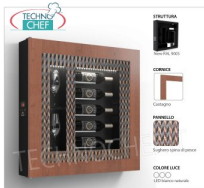
TABLEAU VIN RÉFRIGÉRÉ, 5 BOUTEILLES et 2 VERRES, Temp.+12°/+18°

Tableau vin RÉFRIGÉRÉ, 5 Bouteilles et 2 Verres, version avec: Structure NOIRE, Panneau CHEVRON LIÈGE, Cadre STRATIFIÉ COULEUR CHÂTAIGNIER, Lumière LED Blanc Naturel, Temp.+12°/+18°, V.230/1, Kw.0, 06, Poids 30 Kg, dim.mm.780x780x155h