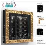
TABLEAU VIN RÉFRIGÉRÉ, 5 BOUTEILLES et 2 VERRES, Temp.+12°/+18°

Panneau à vin RÉFRIGÉRÉ, 5 bouteilles et 2 verres, version avec : structure NOIRE, panneau NOIR MAT, cadre DUNE OR PATINÉ, éclairage LED blanc naturel, Temp.+12°/+18°, V.230/1, Kw.0, 06, Poids 30 Kg, dim.mm.780x780x155h