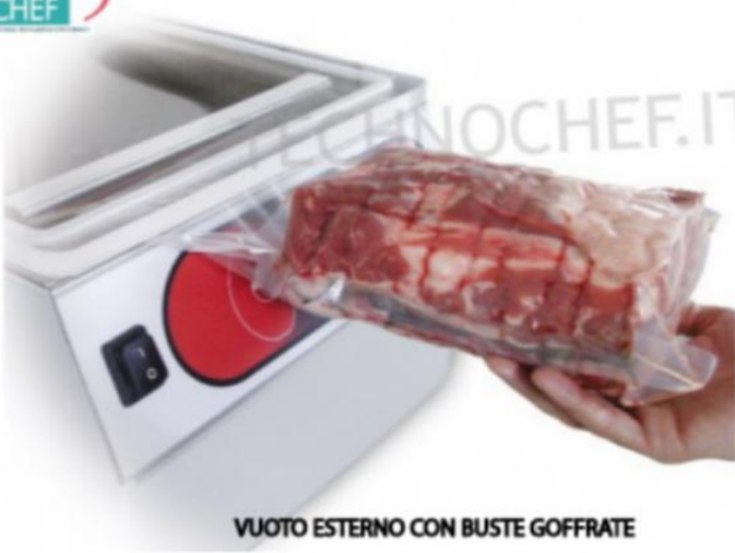
VUOTO ESTERNO CON BUSTE GOFFRATE