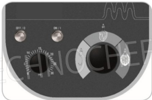
Comandi inox IP 67 Stainless steel IP 67 protected controls