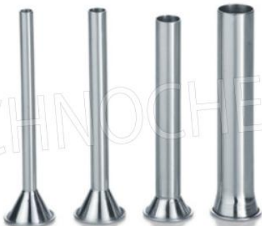
Imbuti inox (ø 13-16-20-25-28-38) opzionali