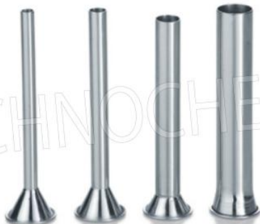
Imbuti inox (ø 13-16-20-25-28-38) opzionali