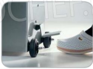
Ritorno pistone automatico