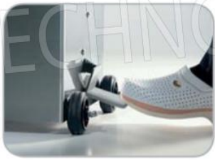
Azionamento spinta pistone