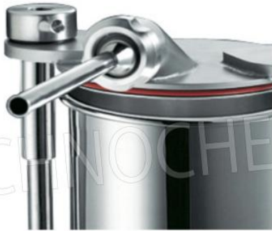
Ghiera inox opzionale