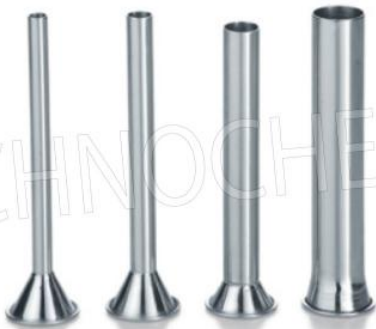
Imbuti inox (ø 13-16-20-25-28-38) opzionali