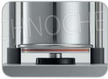
Guarnizione ermetica su cilindro oleodinamico