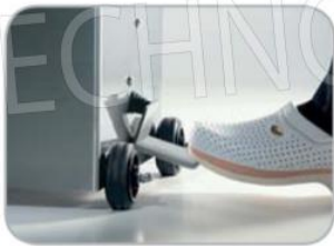
Azionamento spinta pistone