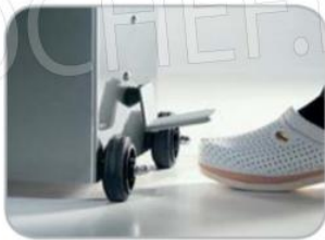
Ritorno pistone automatico