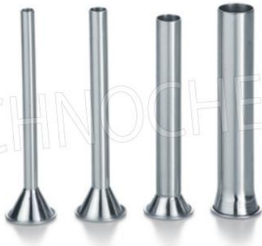
Imbuti inox (ø 13-16-20-25-28-38) opzionali