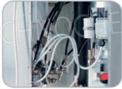
Particolare centralina e comandi