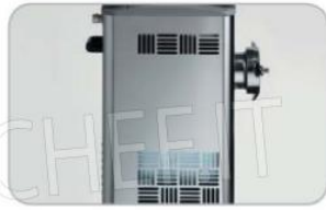
Griglie di ventilazione TC ICE TC ICE airing take