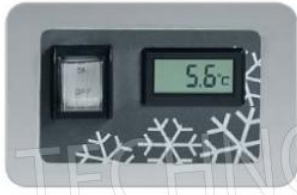
Comandi TC ICE TC ICE controls