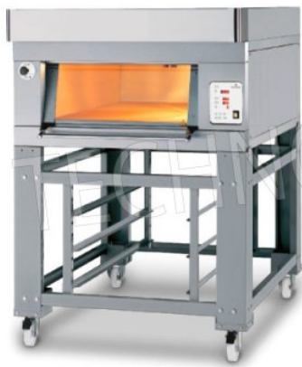
PASTFOOD - H27

Forno elettrico modulare con camera di cottura in lamiera di acciaio alluminata di altezze diverse. Piano di cottura in refrattario o in lamiera bugnata. Elementi riscaldanti elettrici ad altissime prestazioni.