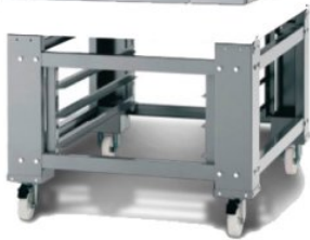
Supporto aperto per forno