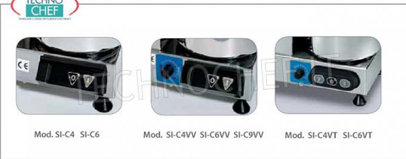
Mod. SI-C4 SI-C6