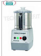
Table CUTTER R4 VV, capacité du réservoir lt.4,5, marque ROBOT COUPE , professionnel

Table CUTTER R4 VV, marque ROBOT COUPE, avec BOL EN ACIER INOXYDABLE amovible de 4,5 litres, Vitesse variable 300 / 3 500 tr/min, V. 230/1, Kw 1,00, Poids 17 Kg, dimensions 225x305x460h mm