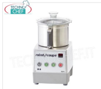
Tableau CUTTER R5-2V, capacité du réservoir lt.5,9, marque ROBOT COUPE , professionnel

Table CUTTER R5-2V, marque ROBOT COUPE, avec BOL EN ACIER INOXYDABLE amovible de 5,9 litres, Vitesse 1 500 / 3 000 tr/min, V. 400/3, Kw 0,75, Poids 22 Kg, dimensions 280x350x490h mm