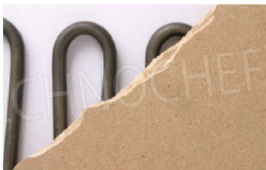
Particolare del piano di cottura in materiale refrattario e delle resistenze corazzate.