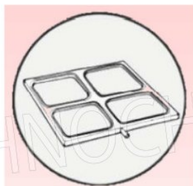
STAMPO GN 1/8 MOULD GN 1/8