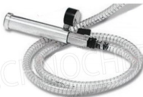
TUBO CON MANICOTTO ADATTATORE PER VUOTO IN CONT. GASTRO