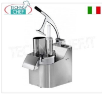
Tavolo, Mod. TV2000R